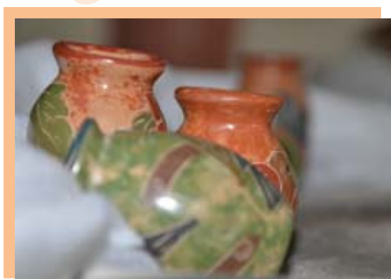
Ambientación en la sala de conferencia

Como barro en las manos del alfarero . . .